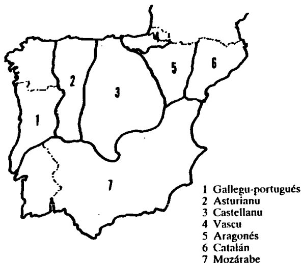
Les llingües peninsulares hacia l'año 1200.

La imposición del castellán ye, en bona medida, consecuencia de la política fecha por Castiella. En Las Vidas de los Santos Religiosos xustificase l'escrivila'n castellán asina: «E porque el real imperio que hoy tenemos es castellano, e los muy excellentes rey e reyna nuestros senyores han escogido como por asiento e silla de todos sus reynos el reyno de Castilla deliberé de poner la obra presente en lengua castellana, porque la fabla comumente mas que todas las otras cosas sigue al imperio».