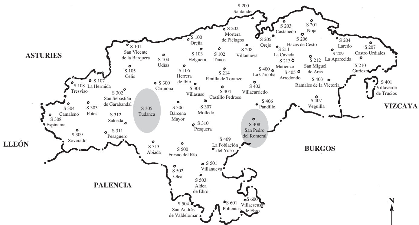
Mapa 1. Lugares de Cantabria encuestados por ALEcant. A la manzorga, Tudanca / A la mandrecha, la fastera pasiega