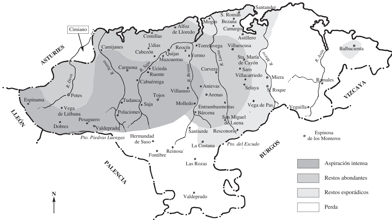
Mapa 3. Intensidad de l'aspiración. Según L. Rodríguez-Castellano (1954)